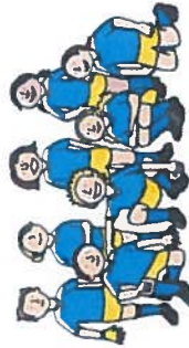
team van 8 kinderen